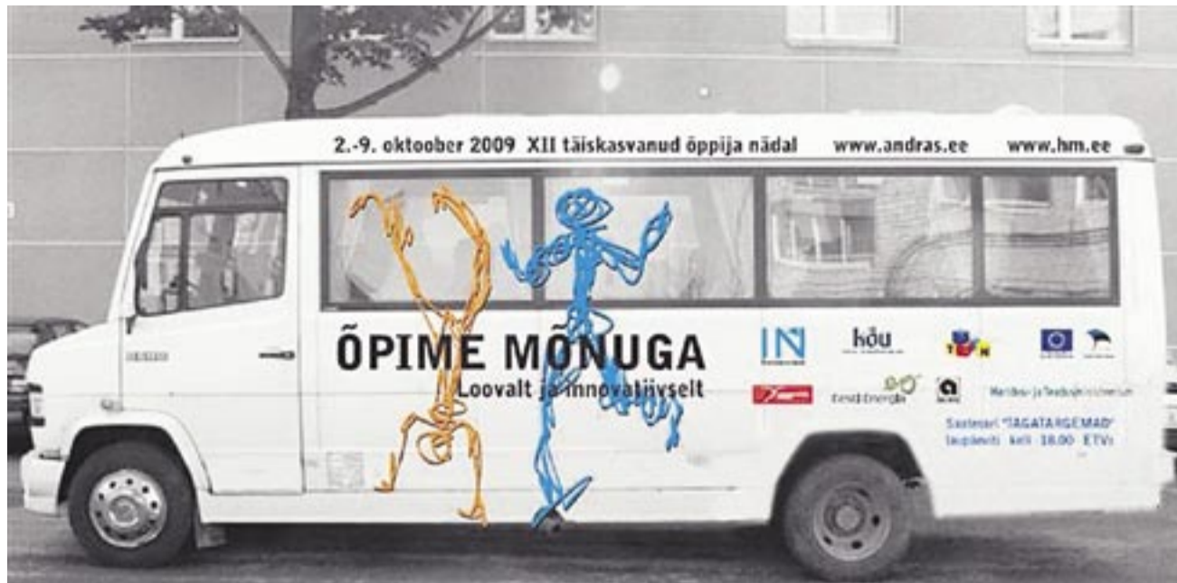
Värvikas õpibuss sõidab oktoobri alguses maakonnas ringi, peatudes Hädemeestel, Tõstamaal, Vändras.