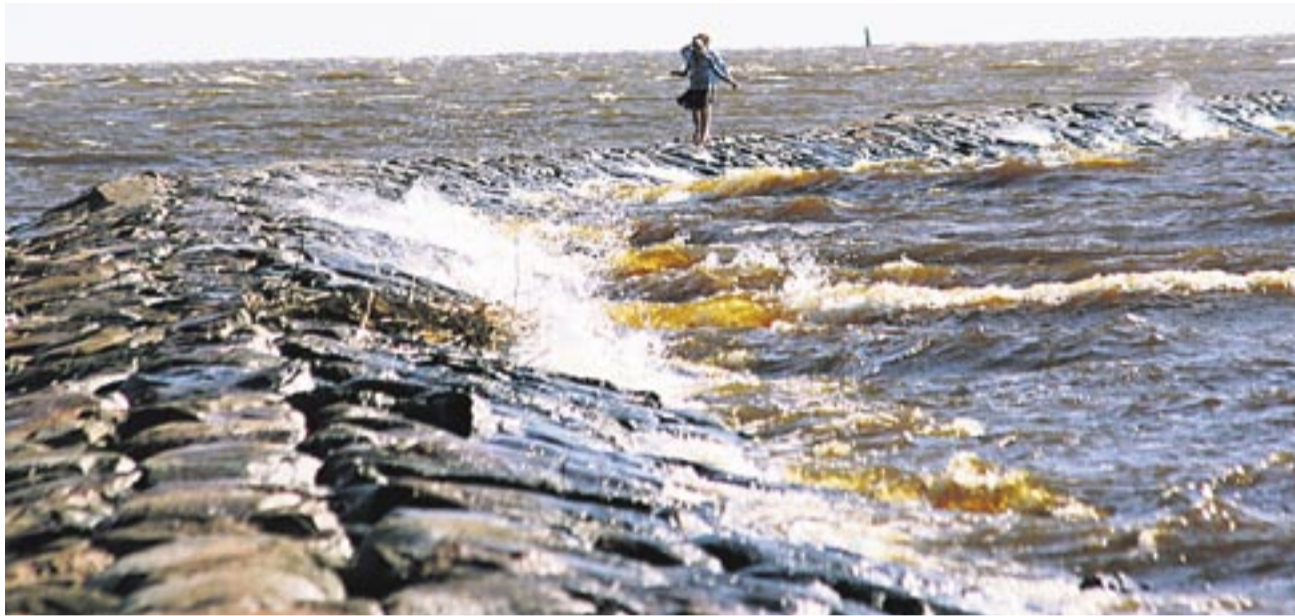
Pärnu suvekülastajate magnet on ajalooline muul, millel meeleldi jalutamas käiakse.